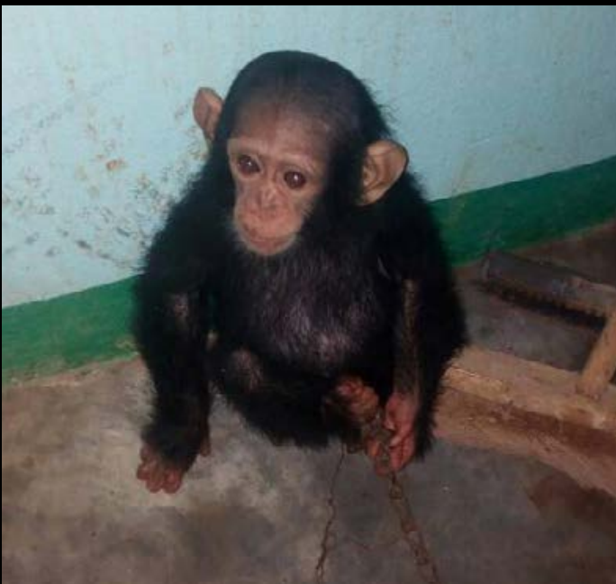
Un bébé chimpanzé a été sauvé et le trafiquant de singes, arrêté au Cameroun