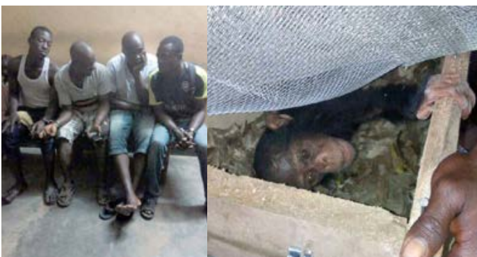
Un autre bébé chimpanzé a été secouru et 4 trafiquants ont été arrêtés.

■ 2 trafiquants arrêtés avec un bébé mandrill et 40 kg d'écailles de pangolin dans la capitale. Ils trafiquaient du sud vers la capitale et y ont amené la contrebande le jour de leur arrestation. Une corde était attachée autour de la taille du petit bébé qui a ensuite été placé dans un minuscule sac pour le