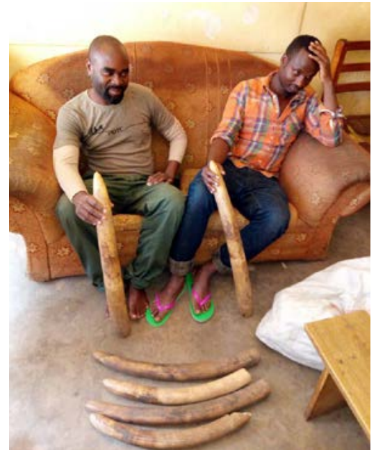
2 trafiquants d'ivoire arrêtés à Kampala avec 6 défenses.