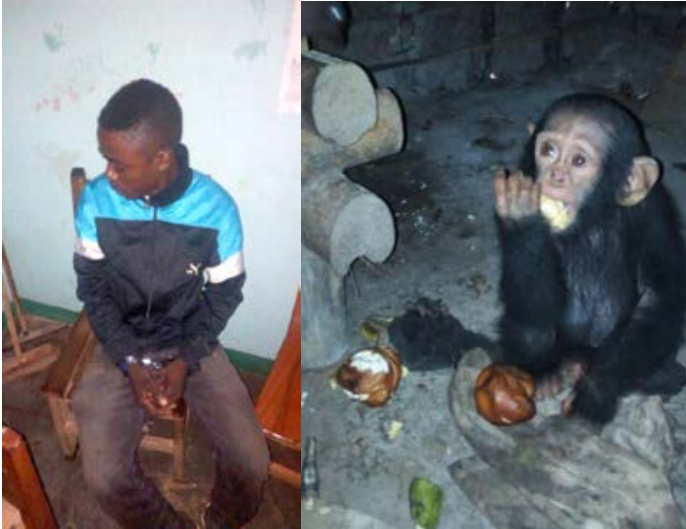
Un bébé chimpanzé a été sauvé et un trafiquant arrêté dans le sud du pays.

■ 7 trafiquants arrêtés et 2 chimpanzés et un mandrill sauvé lors d'une action contre le trafic de primates. Un bébé chimpanzé a été sauvé et un trafiquant de grands singes arrêté dans le sud du pays. Le trafiquant connu pour le trafic de primates vivants, a caché le bébé chimpanzé dans un sac. Le bébé chimpanzé orphelin de 10 mois, nommé Farah, était fort et a été remis à Ape Action Africa pour des soins à vie. Ce fut le deuxième sauvetage de chimpanzé de LAGA dans un court laps de temps.