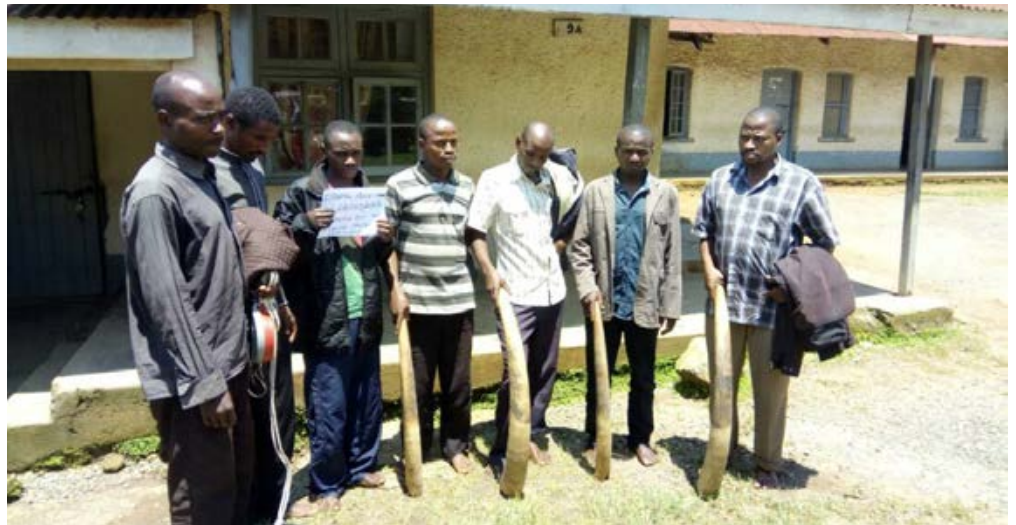
8 trafiquants d'ivoire, dont un officier de l'armée, arrêtés à l'ouest du pays avec 4 défenses.

mifères sur terre. Les rayures sur son derrière aident à camoufler car il ressemble à des traînées de soleil filtrant à travers les arbres. Ces bandes sont uniques à chaque individu et utilisées pour l'identification de sorte que vous pouvez dire que son identité est sur son derrière. Les trafiquants ont avoué avoir échangé d'autres peaux d'okapis dans le passé, soulignant une fois de plus le commerce illégal de cet animal en voie de disparition.