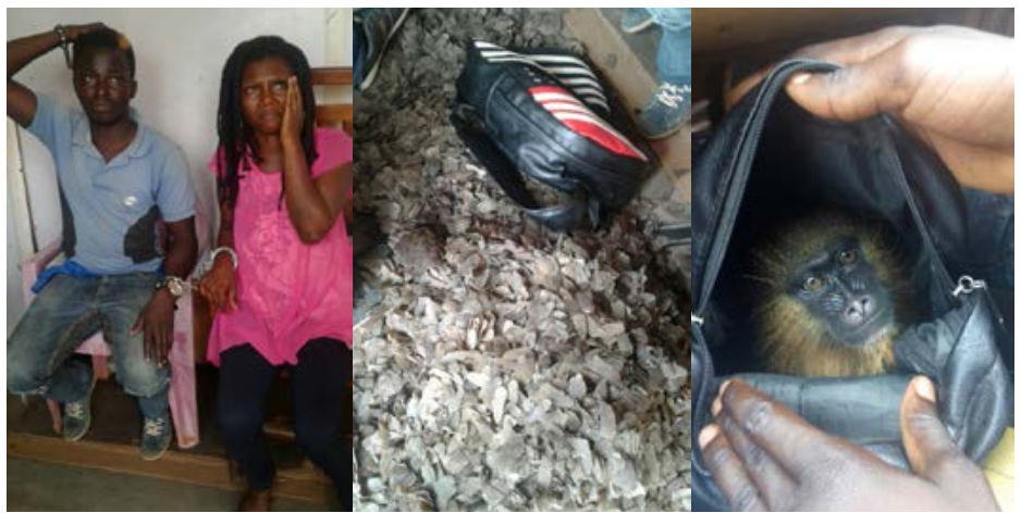
2 trafiquants arrêtés avec un bébé mandrill et 40 kg d'écailles de pangolin