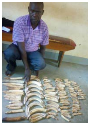
Un trafiquant arrêté avec 102 dents d'hippopotames

■ 2 trafiquants arrêtés avec 127 dents d'hippopotames (56kg) dans l'ouest de l'Ouganda. Cette saisie représente l'abattage d'au moins 15 hippopotames. Cet