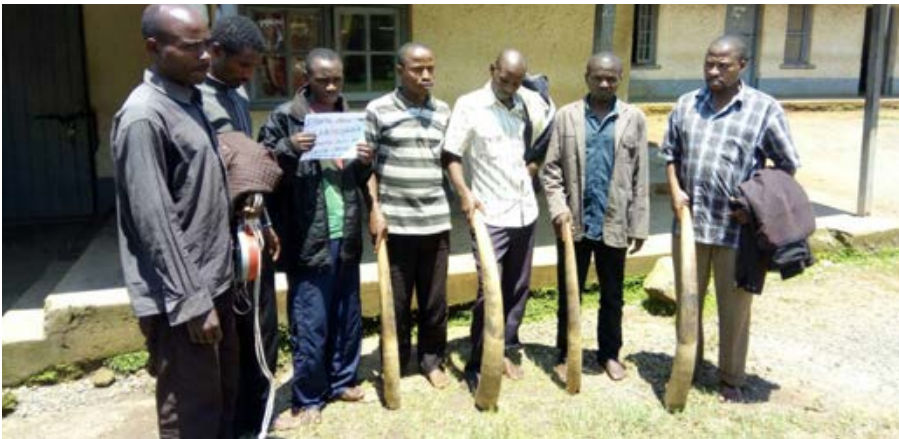
8 trafiquants d'ivoire, dont un officier de l'armée, arrêtés en Ouganda avec 4 défenses.

montaient dans une voiture avec l'ivoire, dissimulé dans un sac en plastique, à l'endroit de la transaction. Plus tard, ils ont dénoncé un officier de l'armée, qu'ils ont embauché pour braconner les éléphants dans le Parc National de Kibale. 3 trafiquants d'ivoire dont un imam de la mosquée de la ville arrêté avec 4 très grosses défenses dans le nord de l'Ouganda. L'imam vient du Soudan du Sud et utilise ses liens pour ce trafic transfrontalier. Les autorités religieuses figurent souvent dans nos opérations, en particulier cette année, exposant la couverture du crime et la cupidité derrière la fausse apparence de la moralité. 2 trafiquants d'ivoire arrêtés à Kampala avec 6 défenses. Ils ont été interceptés devant la banque avec l'ivoire dissimulé dans un sac en polyéthylène, alors