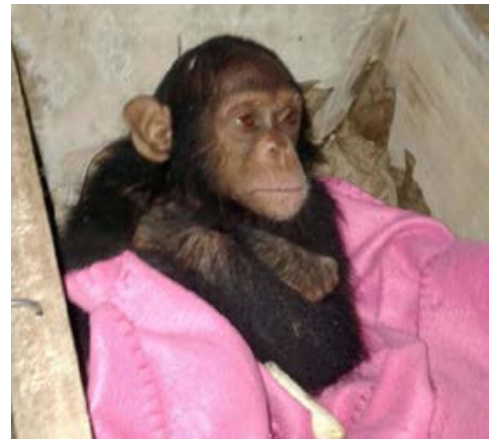
Un bébé chimpanzé a été sauvé et le trafiquant de singes, arrêté au Cameroun