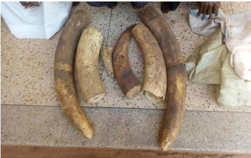
3 trafiquants d'ivoire dont un imam de la mosquée de la ville arrêté avec 4 très grosses défenses

ivoire d'hippopotame provient du parc national Queen Elizabeth.