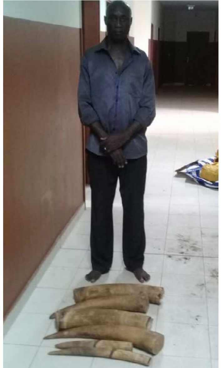
Un trafiquant d'ivoire sénégalais arrêté avec 4 défenses dans la capitale..