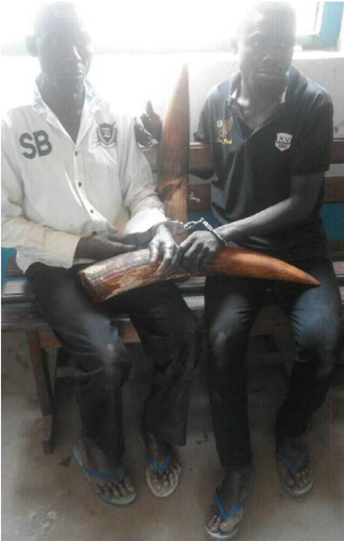
3 trafiquants d'ivoire arrêtés, avec 30 kg d'ivoire,

■ 3 trafiquants d'ivoire arrêtés, avec 30 kg d'ivoire, au Congo. L'équipe du PALF a dû combattre de multiples tentatives de corruption et de trafic d'influence menaçant de libérer les trafiquants. l'un d'eux était connecté à un réseau inter-