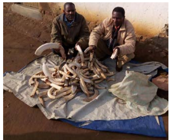
2 trafiquants arrêtés avec 127 dents d'hippopotames (56kg)