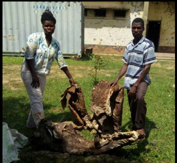
2 trafiquants arrêtés avec 3 peaux d'okapi en Ouganda.