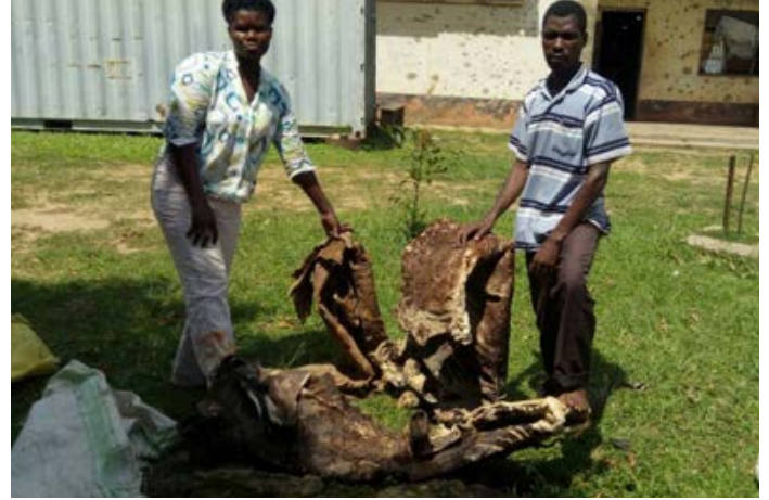
2 trafiquants arrêtés avec 3 peaux d'okapi dans la région du Nil occidental.

arrêtés à l'ouest du pays avec 4 défenses. 7 d'entre eux ont été interceptés sur les faits alors qu'ils montaient dans une voiture avec l'ivoire, dissimulé dans un sac en plastique, à l'endroit de la transaction. Plus tard, ils ont dénoncé un officier de l'armée, qu'ils ont embauché pour braconner