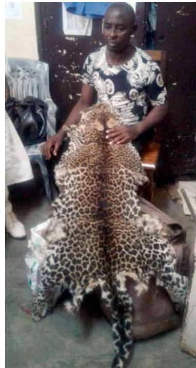
Un trafiquant arrêté en possession d'une peau de léopard

■ Un trafiquant arrêté en possession d'une peau de léopard et 42 kg d'écaillés de Pangolin. Il a voyagé de Douala à la Capitale où il a été arrêté avec sa marchandise. Il réside au Gabon où il dirige un gang criminel de petits trafiquants approvisionnant la contrebande en réseau avec des Chi-