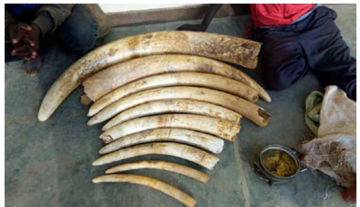
2 trafiquants d'ivoire Kenyans arrêtés avec de 49 kg d'ivoire