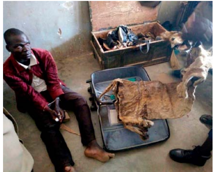
Un trafiquant arrêté en possession d'une peau et une mâchoire de lion

à pratiquer différents types de contrebande entre le Kenya et l'Ouganda. L'un d'entre eux possède un restaurant.