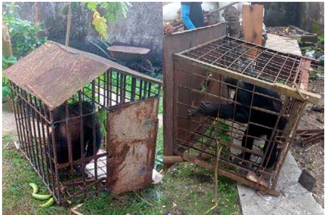
2 femelles Chimpanzés fourrées dans deux petites cages.

■ Le Directeur Adjoint a voyagé en Côte d'Ivoire pour continuer à recruter et former une nouvelle équipe du Projet. Après son retour, le Directeur intérimaire s'est également rendu dans ce pays pour continuer le même travail.