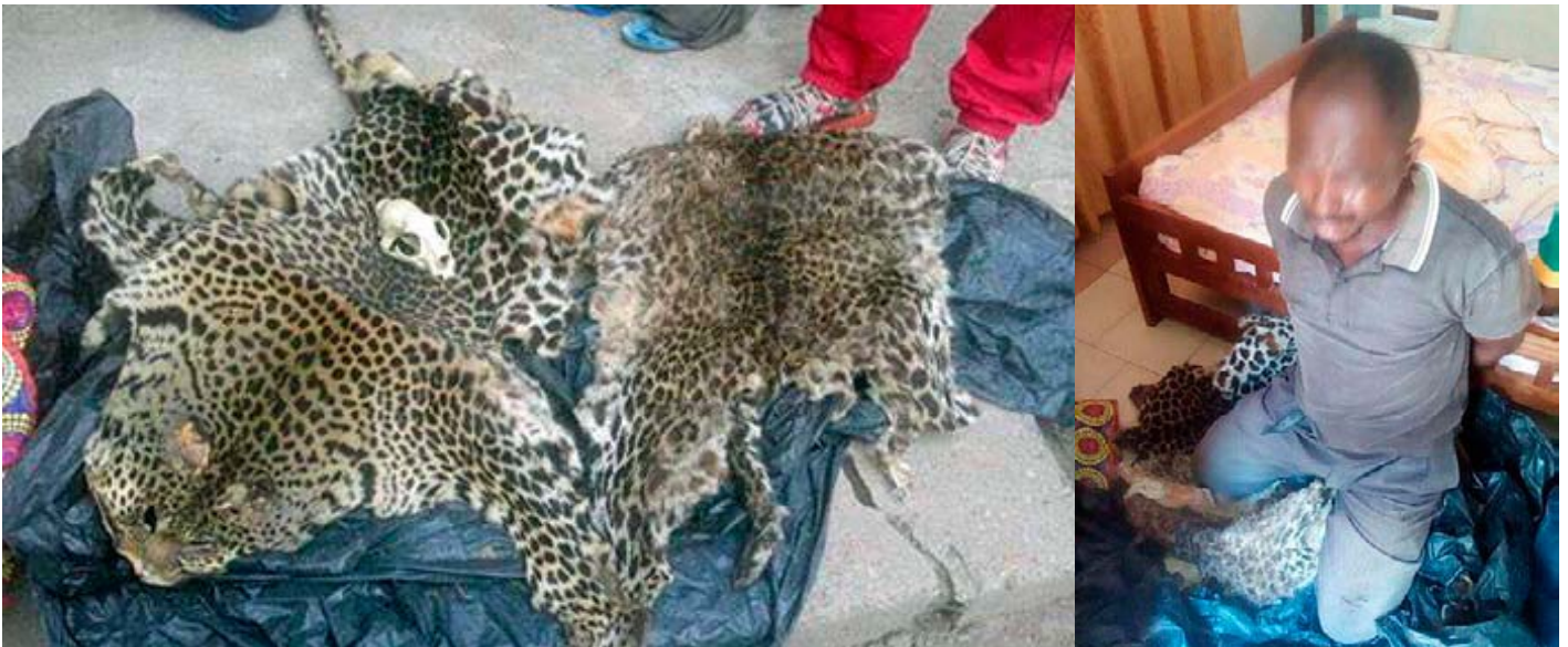
2 trafiquants de peau de léopard ont été arrêtés avec 2 peaux.