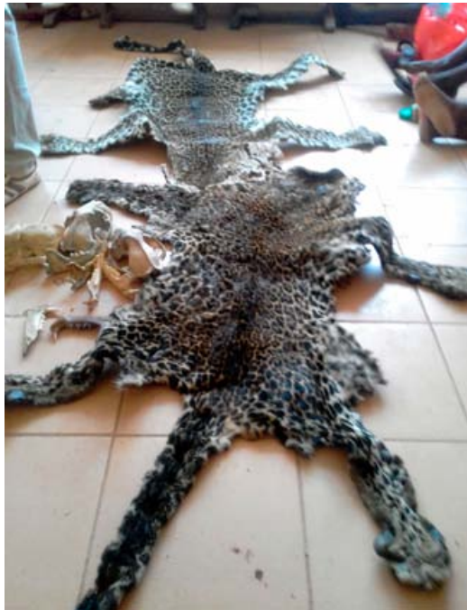
7 trafiquants de peau de léopard arrêtés

■ 7 trafiquants de peau de léopard arrêtés. Les 3 premiers ont été arrêtés en flagrant délit avec 2 peaux de léopard, 3 crânes et des dents. Une troisième peau a été saisie quand un quatrième membre du Gang, un chauffeur, a été arrêté. Ils ont dénoncé et permis l'arrestation de 3 autres complices qui approvisionnaient le réseau en peaux de léopard et autre contrebande. L'un d'entre eux est un chef de village.