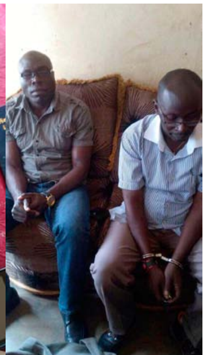
2 trafiquants arrêtés dans la capitale avec 6 défenses d'éléphant et un paquet de papier utilisé pour imprimer du faux billet.