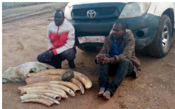
2 trafiquants d'ivoire Kenyans arrêtés en possession de 49 kg d'ivoire, ils ont utilisé un véhicule gouvernemental offert par l'UNICEF

7 trafiquants d'ivoire, dont deux prêtres, arrêtés en Ouganda dans 3 différentes opérations. De la fausse monnaie a été trouvée dans 2 des 3, montrant le lien entre le trafic de faune et d'autres formes de crime. 2 trafiquants d'ivoire Kenyans arrêtés en possession de 49 kg d'ivoire, l'un d'entre eux est prêtre. Ces trafiquants ont utilisé un véhicule gouvernemental offert par l'UNICEF, pour transporter la contrebande hors de la frontière kenyane, tout comme ils ont commercé l'ivoire avec un prêtre complice dans le Comté Ouest de Pokot,