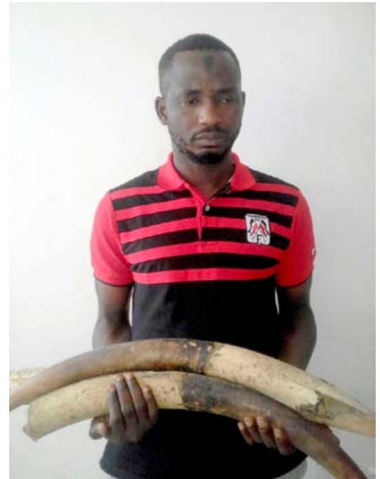
Un trafiquant d'ivoire de la Côte d'Ivoire arrêté en possession de 3 défenses

■ AALF a entrepris le suivi juridique du cas de 3 trafiquants chinois arrêtés à l'aéroport avec 39 pièces