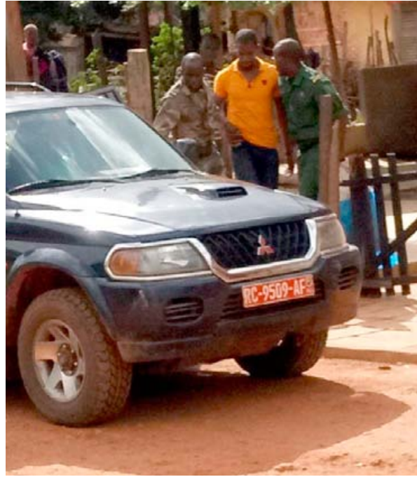
Un trafiquant arrêté avec une peau de léopard et deux de crocodile,

afin de renforcer la coopération et discuter des cas en cours, parmi lesquels : le point focal de la CITES, Le point focal de la lutte contre le crime sur