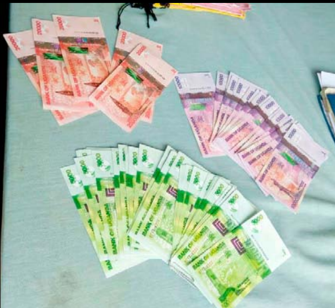
3 trafiquants d'ivoire arrêtés avec des faux billets, 34 kg d'ivoire et deux dents d'hippopotame.