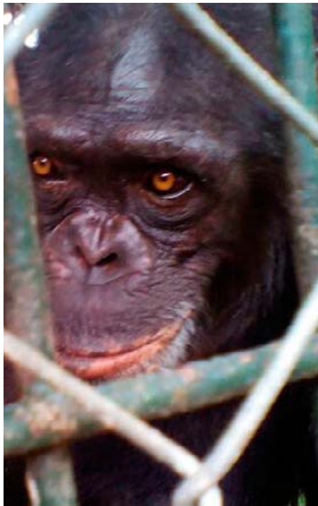
2 trafiquants de singes arrêtés au Cameroun,

■ 2 trafiquants de singes arrêtés, 2 chimpanzés adultes secourus et le réseau démantelé. Ils ont été arrêtés à l'entrée de la zone de cargaison de l'aéroport international de Douala avec 2 femelles Chimpanzés fourrées dans deux petites cages. Un des trafiquants a été pendant longtemps dans le commerce de primate. Les deux chimpanzés ont vécu pendant des années dans des minuscules cages où ils ne pouvaient même pas se tenir debout. Ils ont immédiatement été transportés au LIMBE WILDLIFE CENTER pour un suivi sanitaire.