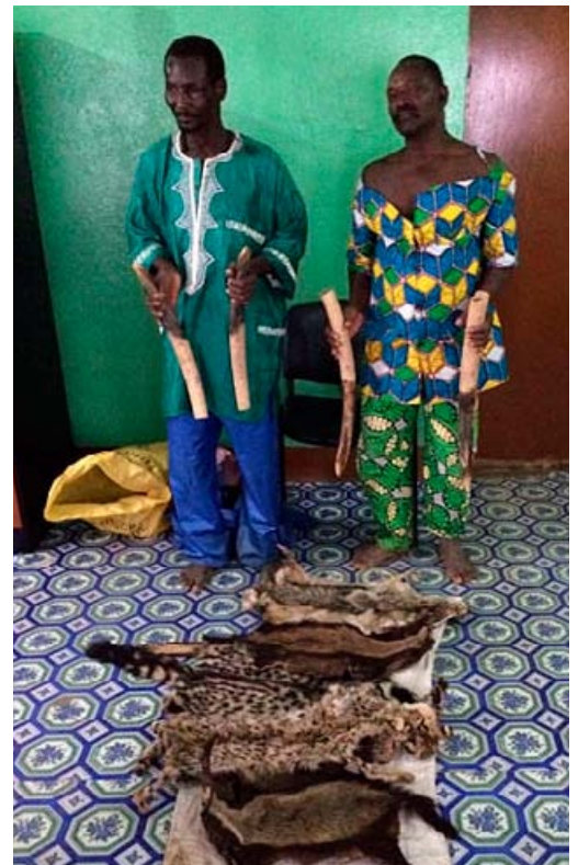
2 traffickers arrested near the Burkina Faso border with 4 tusks and skins