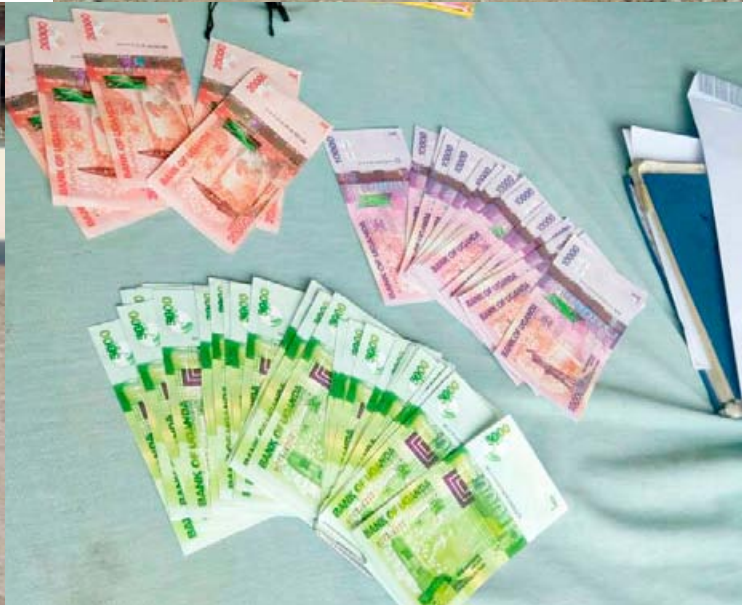
3 trafiquants d'ivoire arrêtés dans l'Est du pays avec des faux billets, 34 kg d'ivoire et deux dents d'hippopotame.

tés d'officiels gouvernementaux dans le trafic frontalier. Le trafic d'ivoire est courant dans cette partie du pays, entre le Kenya et l'Ouganda.