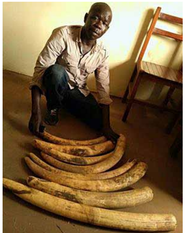
Un autre trafiquant avait été arrêté dans la capitale ougandaise avec 20.5 kilos d'ivoire

2 trafiquants d'écailles de pangolin ont été arrêtés avec 25 kilos d'écailles de pangolins géants en Ouganda. Un homme et