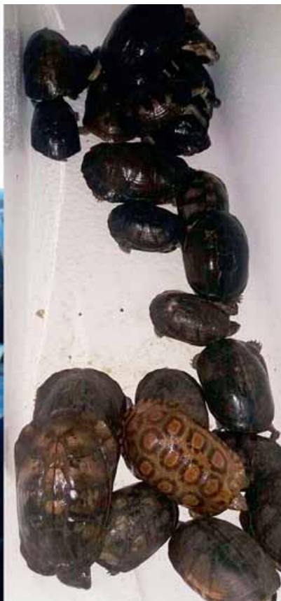
Un trafiquant de reptiles arrêté