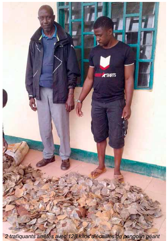
2 trafiquants arrêtés avec 128 kilos d'écailles de pangolin géant