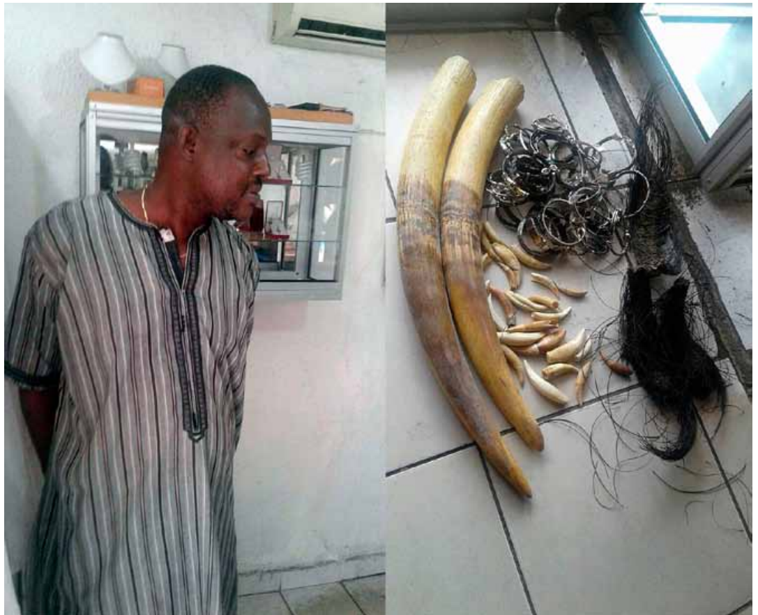
Un trafiquant d'ivoire a été arrêté dans sa bijouterie. La fouille de la maison a révélé 2 défenses d'éléphant, 24 dents de léopard, 50 bracelets en poil d'éléphant et 3 queues d'éléphants.