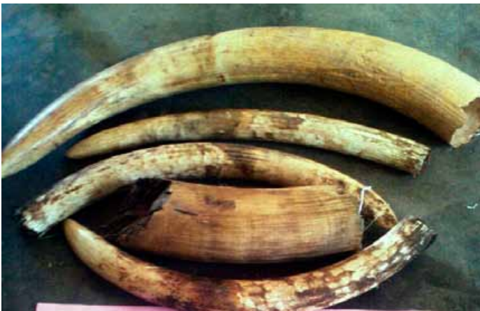
3 trafiquants d'ivoire arrêtés avec 36 kg d'ivoire près de la frontière congolaise.