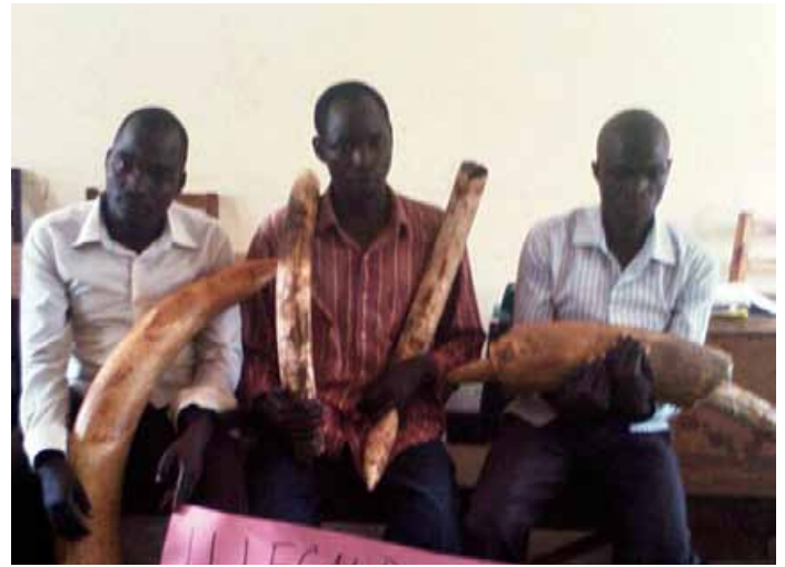
Trois trafiquants d'ivoire arrêtés avec 36 kg d'ivoire près de la frontière congolaise. 2 trafiquants d'ivoire arrêtés avec 4 défenses d'éléphant pesant 10, 5 kg.