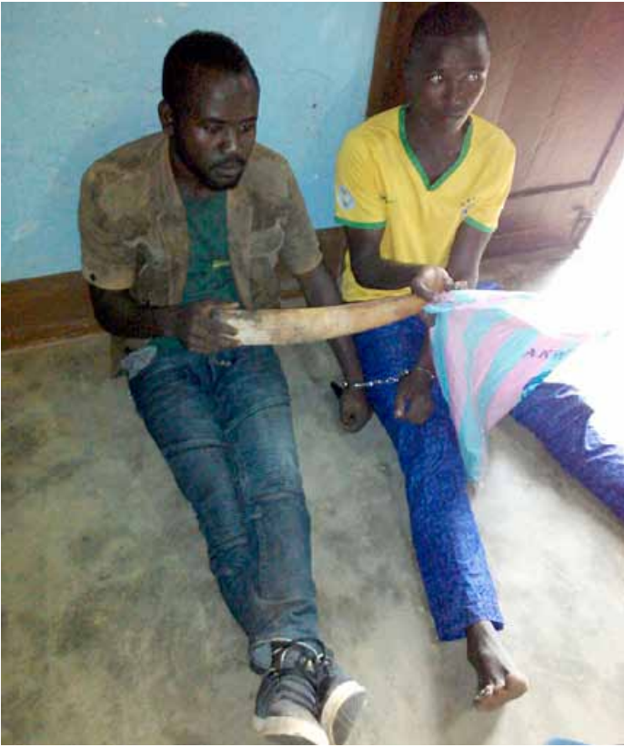
2 trafiquants d'ivoire ont été arrêtés