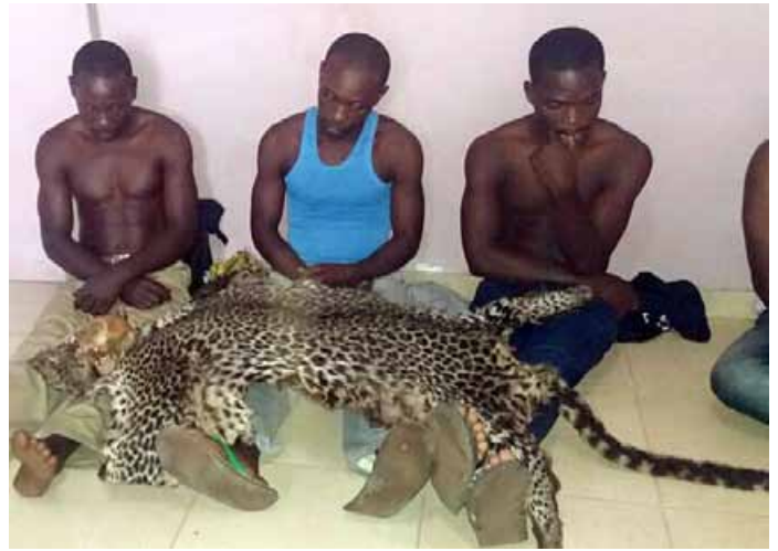
4 trafiquants ont été arrêtés avec 2 peaux de léopard et un crâne de chimpanzé.