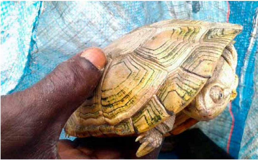
3 trafiquants arrêtés avec 128 de tortue d'eau douce.

saison sèche elles hibernent, et à la fin de la saison sèche, elles sont intensivement victimes du trafic. Elles sont souvent vendues à des chinois en tant que met de choix, mais elles sont aussi exportées en Europe et aux Etats-Unis ou elles sont appréciées en tant qu'animaux de compagnie. Toutes les tortues d'eau douce sont intégralement protégées au Sénégal. Les tortues saisies ont été envoyées dans un centre de réadaptation et plus tard elles seront libérées dans le Parc National Niokolo-Koba.