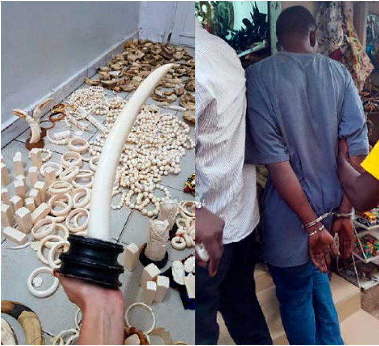
2 importants trafiquants internationaux ont été arrêtés à Dakar dans deux opérations consécutives avec une saisie de 780 objets en ivoire sculpté.

l'Environnement pour discuter de la mise en œuvre du Mémorandum d'entente et de la gestion de la contrebande saisie lors des arrestations au Sénégal.