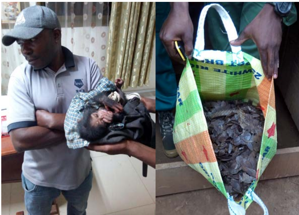
Un bébé chimpanzé a été secouru et un trafiquant de faune arrêté. Il transportait également 35 kg d'écailles de pangolin.

un état déplorable de malnutrition et a été immédiatement transporté au parc national de Mefou, où les soignants d'Ape Action Africa ont rapidement apporté les soins appropriés.