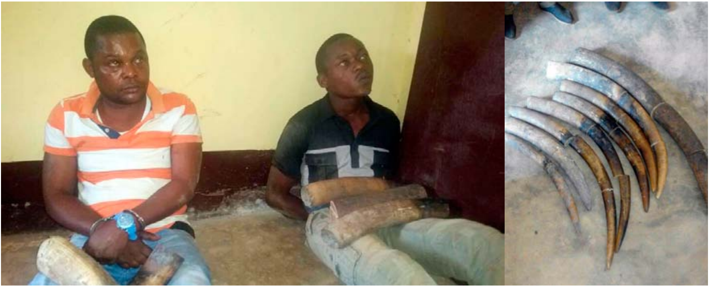
2 trafiquants d'ivoire ont été arrêtés avec 8 défenses au Congo, coupé à 21 pièces

Gabon. L'un d'entre eux, propriétaire d'un hôtel, se trouve au centre de plusieurs réseaux de trafiquants. L'autre a transporté l'Ivoire vers le lieu de la transaction. Ils ont déjà été arrêtés pour trafic d'ivoire, mais ont été irrégulièrement libérés par le tribunal de Pointe-Noire. Maintenant, ils restent derrière les barreaux, en attendant leur jugement.