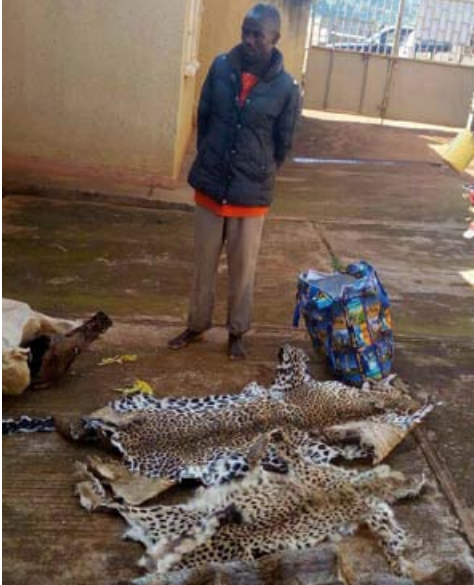
2 trafiquants arrêtés avec une peau de guépard et une peau de léopard