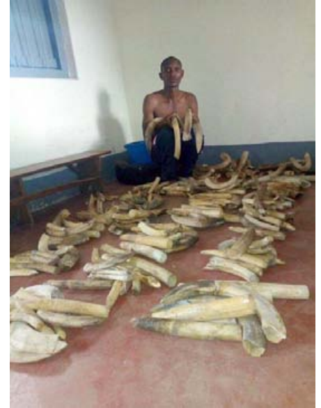
Un trafiquant arrêté dans l'ouest de l'Ouganda avec 215 dents d'hippopotame

■ 2 trafiquants arrêtés avec une peau de guépard et une peau de léopard près de la frontière du Kenya. Ils ont trafiqué la faune pendant plusieurs années. Le premier a été arrêté entrain de vendre les peaux de guépard, de léopard et de 3 pythons. Son complice trafiquant a été arrêté plus tard dans sa maison avec 3 autres peaux de python. Il reste moins de 6 800 guépards dans le monde, ce qui en fait de lui le félin le plus menacé du continent. Il y a moins de 30 guépards en Ouganda, ce qui en fait une opération d'arrestation très significative ;