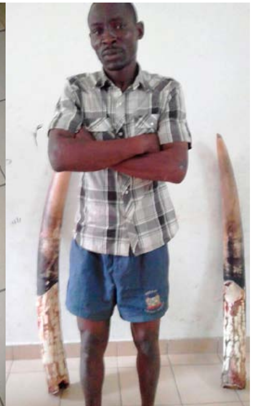
Un trafiquant d'ivoire, un récidiviste, arrêté avec 2 grandes défenses d'éléphants frais