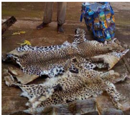
2 trafiquants arrêtés avec une peau de guépard et une peau de léopard en Ouganda

« Arrêtez-le pour moi! » Le chimpanzé d'orphelin d'un mois a été immédiatement transporté au parc national de Mefou, où les soignants d'Ape Action Africa ont rapidement apporté les soins appropriés.