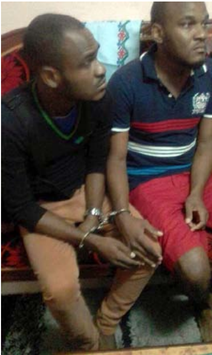
3 trafiquants d'ivoire arrêtés dans la capitale.

de renforcer les peines dissuasives au Gabon, car la peine maximale actuelle est l'une des plus faibles en Afrique.