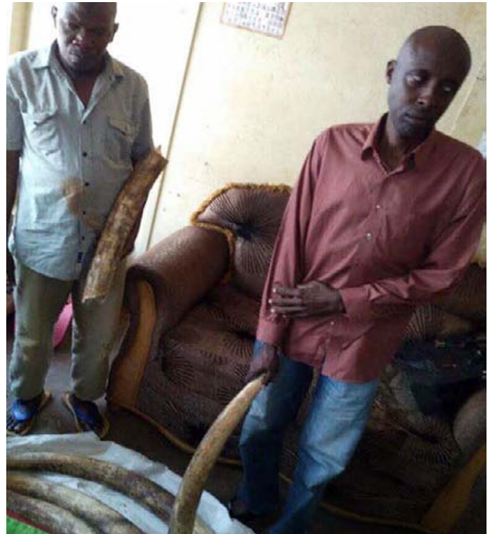
2 trafiquants d'ivoire arrêtés à Kampala avec 4 défenses.

harmonisation de l'écart d'investigation dans les enquêtes en cours.