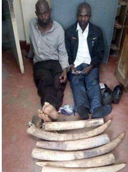
2 trafiquants d'ivoire arrêtés à Kampala avec 4 défenses.