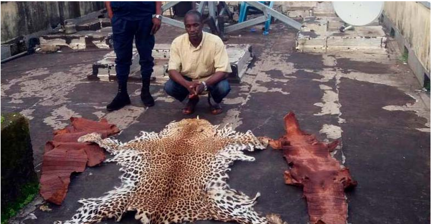
Un trafiquant arrêté avec une peau de léopard et deux peaux de crocodile à Conakry.