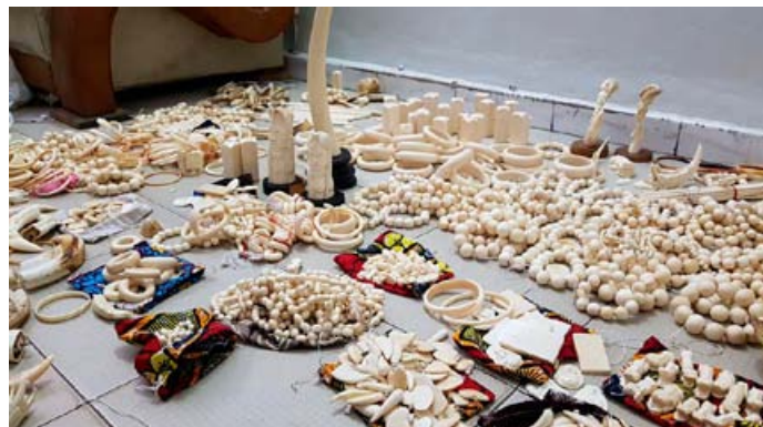
2 importants trafiquants internationaux ont été arrêtés au Sénégal et 780 articles en ivoire sculpté saisis.

4 trafiquants d'ivoire arrêtés dans 2 opérations différentes au Gabon. 3 trafiquants d'ivoire arrêtés dans la capitale. Les deux premiers sont des frères et ont été arrêtés en flagrant délit de vente de 2 défenses d'éléphants. Ils ont admis prendre l'ivoire avec leur oncle, qui travaille avec eux. Ce dernier a été arrêté deux jours plus tard. Un trafiquant d'ivoire, un récidiviste, arrêté avec 2 grandes défenses d'éléphants frais à Franceville. Il a déjà été arrêté pour trafic d'ivoire en 2014, transportant 4 défenses dans un train vers la capitale et il avait passé 6 mois de prison. Cette affaire souligne la nécessité de renforcer les peines dissuasives au Gabon, car la peine maximale actuelle est